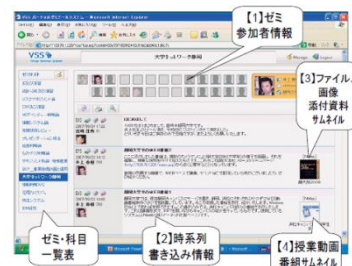
P4Web vivid+P4Webバーチャルゼミナールシステム